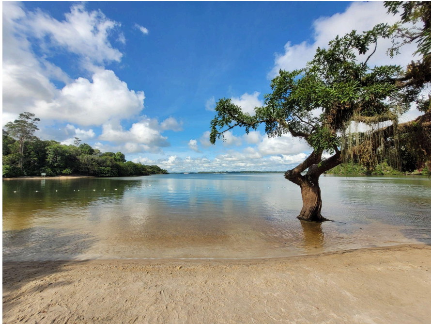
A Majestosa Juparanã Lagoa Juparanã, Linhares - 2025 Autor: Victor Conte André