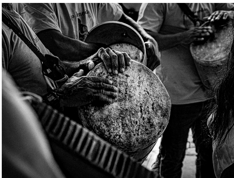
Tambores Banda de Congo Pedrolândia São Rafael, Linhares - 2025 Autor: Breno Zardini Rocha