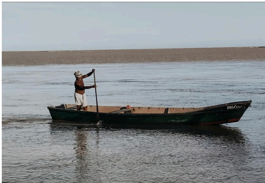
Remando Memórias: O tempo nas águas do Rio Doce Regência, Linhares - 2025 Autora: Maria Eduarda de Bruin de Oliveira