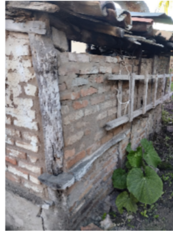
Imagem 02 - Escada atrás da casinha de fogão a lenha.