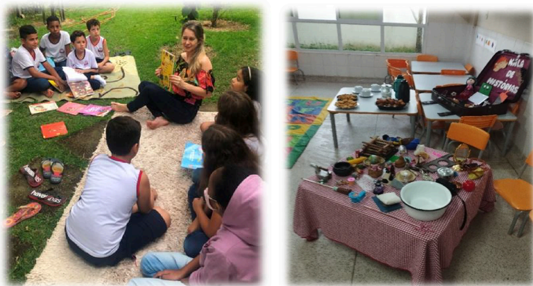
Imagem 3 - Encontros de forças que atravessam o pensamento.

No entrelaçamento de uma pluralidade de atividades humanas, os corpos afetam alegria e por esta são afetados, aumentando a potência de agir uns dos outros na arte dos encontros, nas aberturas, nas “maneiras de ser e das ‘ocupações’ num espaço de possíveis” (Rancière, 2009, p. 63). Gestos que potencializam a sensibilidade dos corpos por meio de práticas artísticas na constituição do comum, na partilha do sensível. Movimentos que nos provocaram a pensar os currículos, as infâncias, as docências, as escolas, como modos de resistência às políticas normativas. Encontros que anseiam por uma vida nos entremeios da imanência dos currículos.