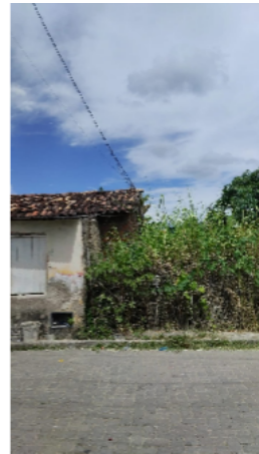
Imagem 06 - Espaço da sede do Mangalô recentemente, Castro Alves/BA.