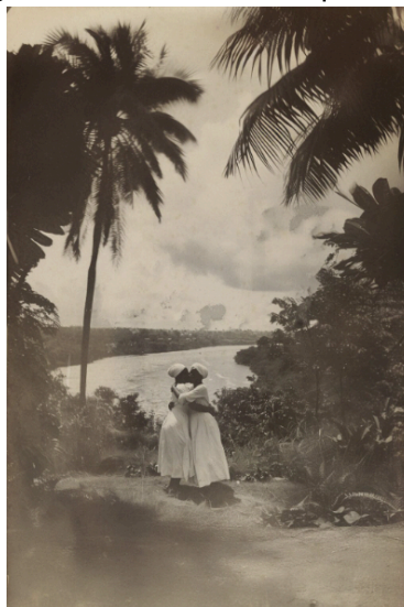
Imagem 01. Álbum de Desesquecimentos

Na primeira imagem (Imagem 01), em que duas mulheres aparecem abraçadas em uma paisagem natural, próxima a um rio e cercadas por vegetação, o afeto é inscrito em uma dimensão territorial e ancestral. A amplitude da paisagem contrasta com a pequena escala dos corpos, sugerindo que o amor entre essas mulheres não é um acontecimento isolado, mas parte de uma relação com a terra, a travessia, a natureza e a memória coletiva. Juridicamente, a cena permite discutir o direito à presença simbólica: essas mulheres não aparecem como mão de obra, objeto de exploração ou figura marginal, mas como sujeitos que ocupam a paisagem com afeto, desejo e pertencimento.