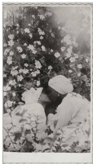
Imagem 04. Álbum de Desesquecimentos

Na quarta imagem (Imagem 04), em que duas mulheres se beijam entre flores, o enquadramento fechado e a presença da vegetação produzem uma atmosfera de segredo, proteção e delicadeza. A cena sugere que o amor, quando perseguido ou tornado socialmente impossível, encontra frestas para existir. Entretanto, a imagem não deve ser lida apenas como clandestinidade; ela também pode ser interpretada como afirmação de beleza e fertilidade simbólica. As flores que cercam o beijo funcionam como metáfora de vida, continuidade e memória, deslocando o imaginário histórico que associou mulheres negras apenas à dor, ao trabalho compulsório ou à maternidade violentada.