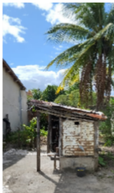
Imagem 09 – Casinha do fogão a lenha ante.