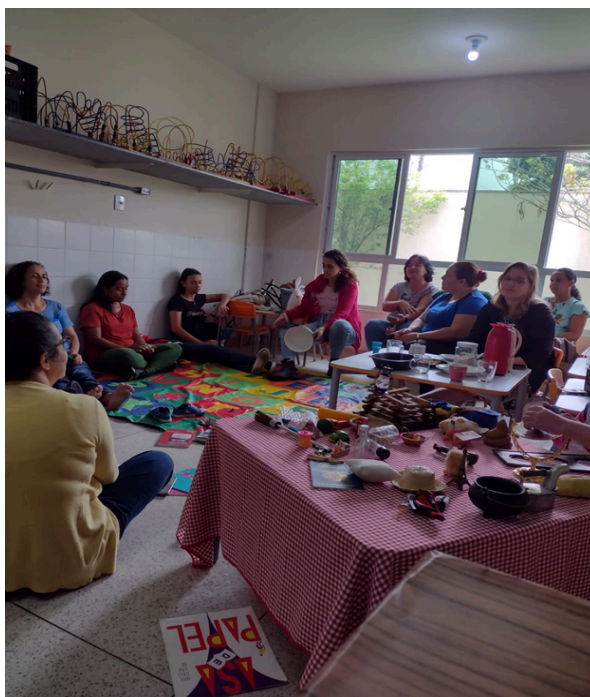
Imagem 2 - Redes de conversações: afecções docentes.

Penso que a gente precisa contar mais histórias com as crianças e deixá-las nos contar também, não apenas reproduzir. As nossas memórias estão repletas de literatura, de afeto. É um avô que contou, é uma professora que leu um livro em sala com a gente... É vida que está saindo de nós... (Produção das pesquisas, professora, 2023).