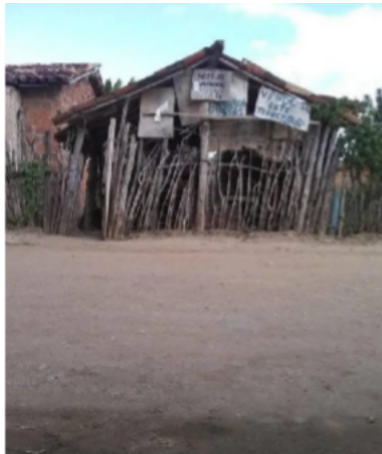
Imagem 05 - Antiga sede do Mangalô, Castro Alves/BA.

Dos questionamentos, surge: Que cidade meu avô ajudou a erguer não está mais visível devido às transformações urbanas? A Imagem 05, apresenta a Sede do Mangalô, um local de socialização dos homens da cidade de Castro Alves/BA. Atualmente, como elucidado na Imagem 06, a Sede não existe mais, deu lugar à vegetação, que tomou o espaço e transformou profundamente o lugar. Um espaço que antes era de socialização, hoje, deu lugar a outras formas de vida.