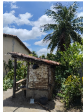
Imagem 10 – Casinha do fogão a lenha depois.

Este trabalho se deleitou em expor como fotos que retratam o cotidiano tem o poder de ser usado como método de escuta na conservação da memória de quem eu amo. A pesquisa não apenas cumpre um papel acadêmico, mas também afetivo, ao transformar a ausência em um objeto de estudo que enriquece a discussão sobre a relação indissociável entre corpo, direito a memória, arquitetura doméstica e o urbanismo das cidades pequenas do interior da Bahia.