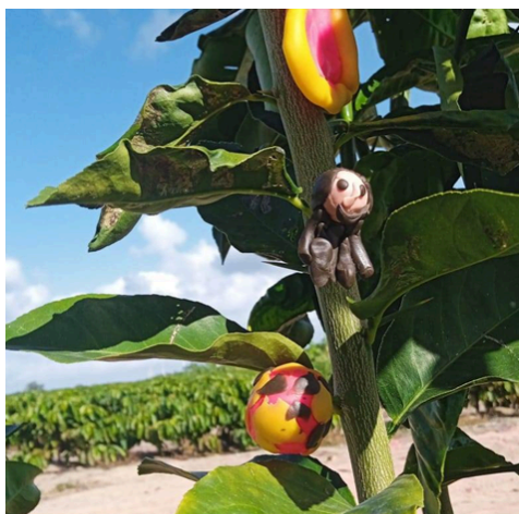
Afeto 01: experimentações estéticas

A partir de Gilles Deleuze, pensar os afetos e as experimentações implica recusar a centralidade da representação e da reconhecimento como formas dominantes do pensamento, abrindo-o para forças que escapam às estruturas já dadas. Em vez de um pensamento que reconhece e repete modelos, trata-se de um pensar que se produz no encontro, no meio dos acontecimentos, nas intensidades que atravessam corpos, imagens e palavras. Nesse movimento, a experimentação estética emerge como campo privilegiado de criação de mundos e de deslocamento das formas fixas de ver e sentir, ativando potências do sensível que desestabilizam currículos e práticas formativas. Assim, os afetos não são apenas estados subjetivos, mas forças que compõem relações, produzem variações e fazem do pensamento um acontecimento vivo, aberto ao inusitado e à invenção.