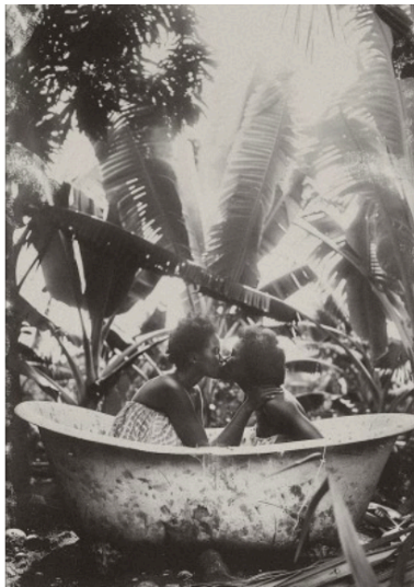
Imagem 02. Álbum de Desesquecimentos

Na segunda imagem (Imagem 02), em que duas mulheres se beijam dentro de uma banheira, a intimidade aparece como forma de reparação simbólica. O banho pode ser lido como cuidado do corpo, descanso e suspensão da violência cotidiana, deslocando o corpo negro feminino da lógica histórica da servidão para a cena do prazer, do toque e da reciprocidade. A imagem permite discutir o direito à intimidade e à dignidade em sentido ampliado, pois apresenta mulheres negras não como corpos disponíveis ao olhar colonial, mas como sujeitos que constroem uma relação de cuidado mútuo. O dado visual mais importante é a delicadeza da cena: o afeto não é espetacularizado, mas protegido.