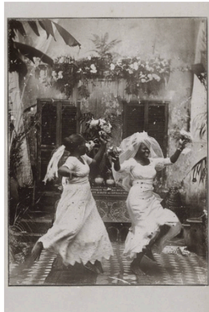
Imagem 05. Álbum de Desesquecimentos

Na quinta imagem (Imagem 05), em que duas mulheres aparecem dançando, o corpo negro é apresentado em movimento, alegria e celebração. A dança rompe com a fixidez do arquivo colonial, que muitas vezes capturou corpos negros em poses de controle, trabalho ou exotização. Aqui, os corpos não são aprisionados pelo olhar externo; eles ocupam a cena em gesto de liberdade. Essa imagem permite discutir a alegria como categoria política: em contextos marcados por racismo, lesbofobia e apagamento, dançar, celebrar e partilhar uma cena pública de felicidade torna-se também uma forma de disputar o direito à memória e à existência plena.