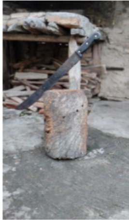
Imagem 01 - Facão e tora de madeira.

gravadas em cada um de nós, sobrepostas e misturadas”. Dessa forma, as imagens presentes neste resumo expandido, revelam e se configuram nos gestos e na permanência do meu avô desde a madeira marcada pelo desgaste do tempo até as ferramentas paradas (Imagem 1 e 2). São imagens que resistem ao esquecimento da memória que um dia tomou conta daqueles locais e que trazem consigo o ofício e o saber ancestral materializado na presença do que já foi, ainda presente no ambiente urbano e no cotidiano e de sua casa.