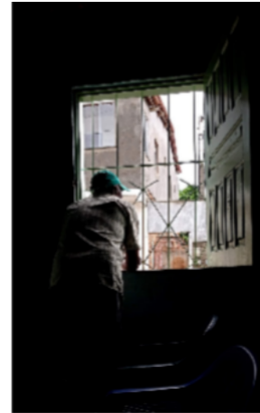
Imagem 04 - Meu avô em pé na janela observando a rua.

Dos questionamentos, surge: Que cidade meu avô ajudou a erguer não está mais visível devido às transformações urbanas? A Imagem 05, apresenta a Sede do Mangalô, um local de socialização dos homens da cidade de Castro Alves/BA. Atualmente, como elucidado na Imagem 06, a Sede não existe mais, deu lugar à vegetação, que tomou o espaço e transformou profundamente o lugar. Um espaço que antes era de socialização, hoje, deu lugar a outras formas de vida.