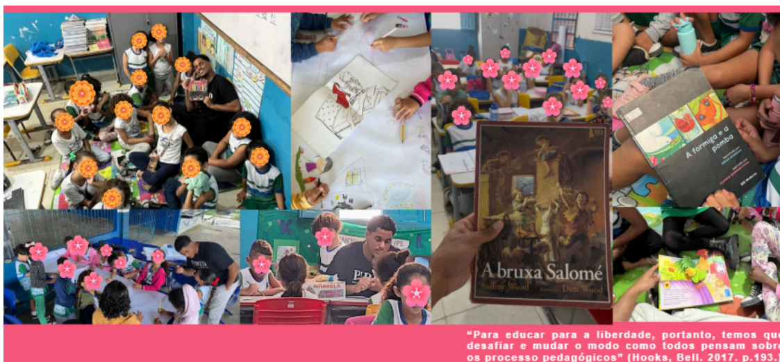
Figura 1: Rodas de leitura e interação dos estudantes

Os resultados observados reforçam a compreensão de que a formação do leitor não ocorre apenas pela apropriação técnica da escrita, mas também pela construção de vínculos afetivos com a literatura. Assim, as práticas de leitura por deleite mostraram-se relevantes para o desenvolvimento do interesse pela leitura, da criatividade e da participação dos estudantes nas experiências literárias propostas pela escola, especialmente quando sustentadas por interações dialógicas e espaço para manifestação dos estudantes.