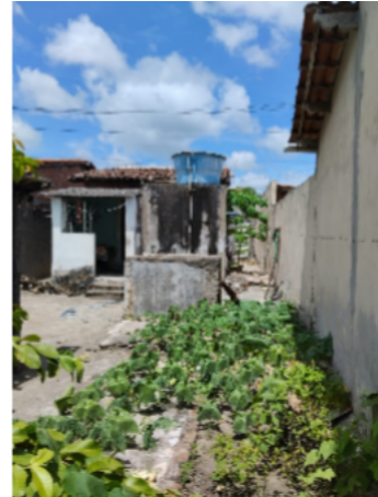
Imagem 08 - O quintal depois. Fonte: Autora, 2024.