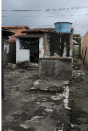
Imagem 07 - O quintal antes.

Para além do questionamento das transformações deixadas pelo que se vai, as fotografias me revelam a passagem do tempo e as transformações do que fica. Mesmo que o espaço tenha mudado após a partida do meu avô, há algo que permanece, seja nos vestígios físicos, nas memórias afetivas que resistem ao tempo e continuam a contar histórias ou na vegetação que cresce livre, recriando o espaço de morar à sua maneira.